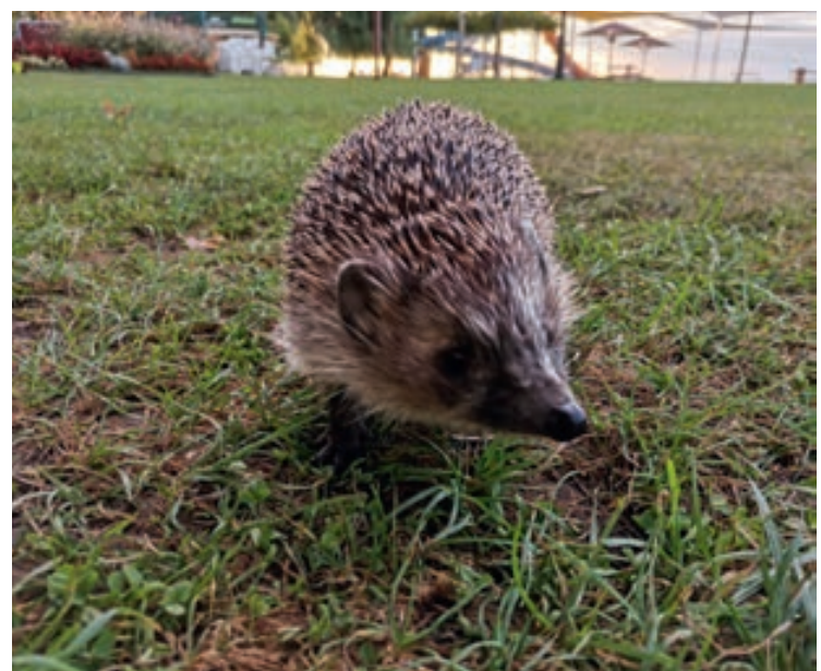
A csopaki Strand sünije aki mindennap örömet szerez és mosolyt csal emberek az arcára.