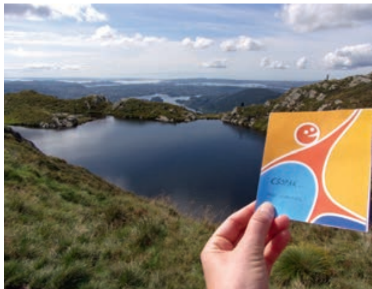
Norvégia, Bergen: Csopak a fjordok felett