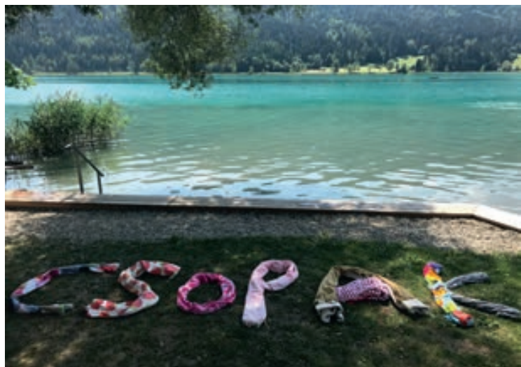
Ausztria, Weissensee: Csopakendők