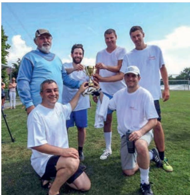
Május 12-én, az I. Csopaki Egészség és Sportnapon – foci történelmet írva – az önkormányzat csapata nyerte meg a focikupát. Három mérkőzés, három győzelem, hét rúgott, nulla kapott gól.

A szélviszonyok végül csak egy rövidített futam megrendezését tették lehetővé, de a kezdők számára nagy élményt jelentett a kezdeti viharfelhők előli partra vontázás, valamint a fiatalok részesei lehettek a hagyományos füredi nagyhajós vitorlabontásnak, lobogófelvonásnak és Balaton-koszorúzásnak is. A gyerekek Évadnyitója egyben a Havas Násas Kupa – kombinált sí- és vitorlásverseny – vitorlázó versenyszáma volt, a márciusi eplényi síverseny folytatásaként, amelyen így végül 2 sífutam, és 1 vitorlásfutam összevonása alapján hirdettek eredményt. A gyerekek Évadnyitóján az első éves, illetve kezdő optimistes versenyzők zöld megkülönböztető szalaggal, de összevont mezőny-