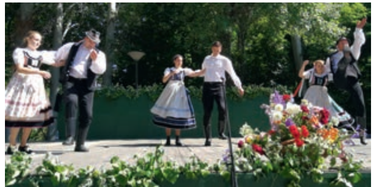
A nyugdíjas találkozót a Csopak Táncegyüttes zárta, akik fergeteges műsorukkal, méltán érdemelték ki a vastapsot a közönségtől.

Ambrus Tibor polgármester köszöntőjében örömét fejezte ki, hogy ismét sokan ellátogattak Csopakra, egyben megköszönte a Csopak Nyugdíjas Klubnak a rendezvény szervezését. – Ez a nap mindig alkalmat ad számunkra, hogy egy kicsit jobban odafigyeljünk önmagunkra. Ilyenkor eszembe jutnak Sütő András szavai, aki azt mondta: önmagát becsüli meg minden nemzedék azáltal, hogy tudomásul veszi, a világ nem vele kezdődött. A mi világunk is önökkel, apáink, nagyapáink életével, munkásságával kezdődött. Önök építették számunkra azt a jelent, amelyben a mi generációnk egy újabb nemzedék jövőjét alapozhatja meg. A település első embere hangsúlyozta, hogy olyan tudást, tapasztalatot, kincset halmoztak fel a jelenlévők, amit meg kell, hogy osszanak. Az utókor erőt, hitet és bátorságot meríthet, a mindennapi munkájukhoz.