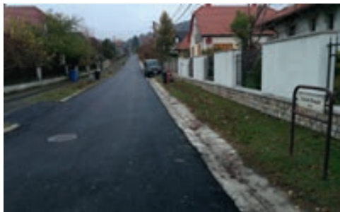
A felújított Szent Donát utca

- Igen. Valóban most folyik az ellátatlan területek csatornázása és a Kishegyi területrészt vízzel való ellátása. A csatornázás az Öreghegyi utca, Boróka utca, Füredi út, belterületi szakaszát, az arra rácsatlakozó utcák egy részét, illetve a Falukertje utcát érintik. A beruházás befejezésével szinte teljesen csatornázott lesz településünk. A másik beruházás az Öreghegyi és Kishegyi utcát, valamint az erre csatlakozó kisebb