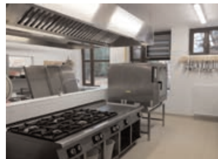
Egy modern gépekkel felszerelt, kényelmes, és a kor szellemének megfelelő konyha lett kialakítva, kiváló szakemberekkel

- Évek óta fontosnak tartottam, mindezt nyomon lehet követni, a testületi üléseken ennek többször is hangot adtam. A gyerekek biztonsága sokkal fontosabb annál, hogy pályázati forrásokban reménykedjünk, ezért az önkormányzat úgy döntött, hogy 10 millió forinttal támogatja a tornaterem felújítását, a többlet költségeket pedig a református közösségünk vállalta át. Így már idén egy felújított, biztonságos tornaterem várja a gyerekeket, sportolókat.