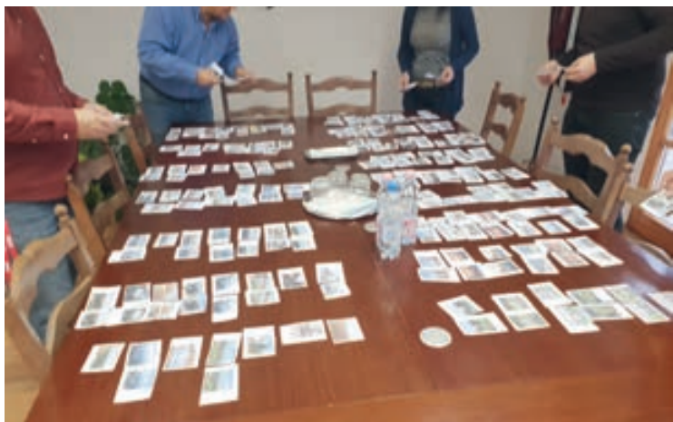
Készül a 2019-es csopaki naptár. A zsűri idén sem volt könnyű helyzetben, mert rengeteg jó fotó közül kellett választani.