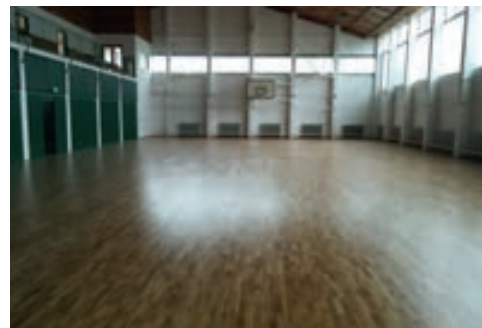
Az önkormányzattal saját forrásból valósították meg 10 millió forint értékben a tornaterem felújítását, a többlet költségeket pedig a református közösség vállalta át

- Nagyon jó volt a fogadtatása és a visszhangja. Azt látom, hogy a védőoltásokat sokan igénybe veszik, a tavasszal meghirdetett